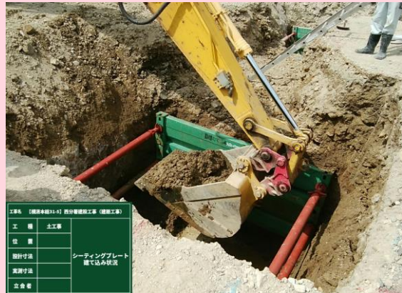
シーティングプレート 建て込み状況