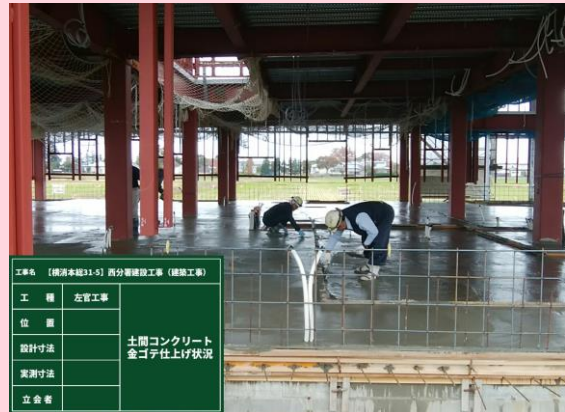
土間コンクリート 金網仕上げ状況