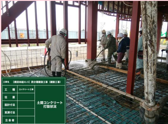
土間コンクリート打設状況