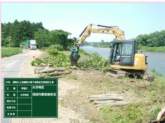
大沢地区(伐採作業状況)

日頃より工事にご協力頂き、誠にありがとうございます。 今月の作業予定は下記のようになっておりますので、お知らせいたします。