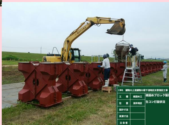
深井地区(根固め製作状況)

大沢の次工程は、土留め・仮締切り、深井地区は引続き、根固め製作となっております。