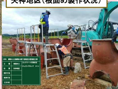
矢神地区(根固め製作状況)