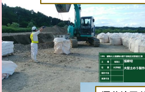
大沢地区(大型土のう製作)

日頃より工事にご協力頂き、誠にありがとうございます。 今月の作業予定は下記のようになっておりますので、お知らせいたします。