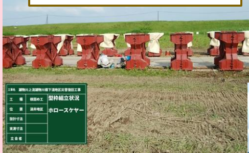
深井地区(根固め製作状況)

＜大沢地区＞ 大型土のうを作っています。 ＜深井地区＞ 根固め製作を行っております。 ＜矢神地区＞ 根固め製作を行っております。 ＜沼館地区＞ 根固め製作を行っております。