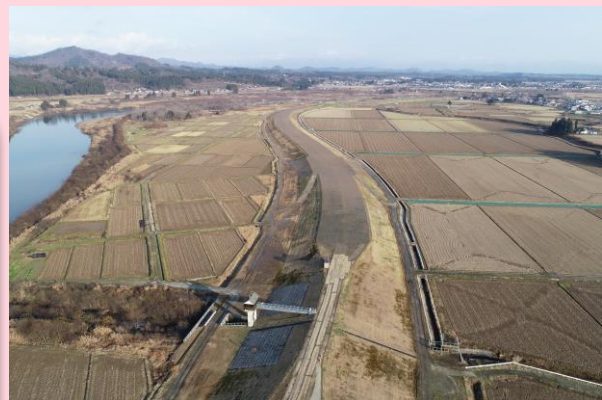
👉 寺館ドローン空撮状況

今後とも地域住民の皆様へ、ご不便 をおかけしますが、工事へのご協 力よろしくお願いいたします。