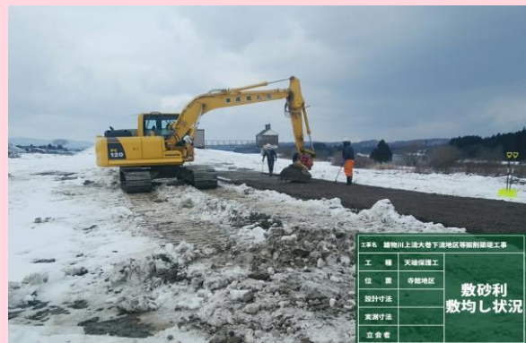
👉 寺館地区 敷砂利状況

今後とも地域住民の皆様へ、ご不便をおかけしますが、工事へのご協力よろしくお願いいたします。