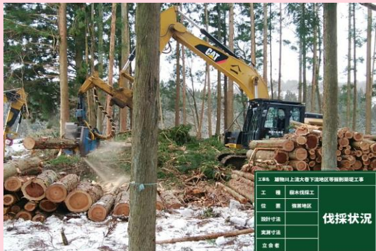
👉 強首地区 伐採状況