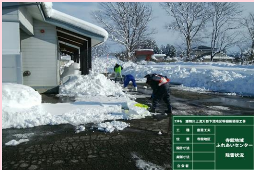
👉 寺館地域ふれあいセンター除雪作業

現在、強首地区にて枝葉運搬作業、大巻地区で伐採作業、寺館地区で敷砂利工、法面保護工を行っています。 1/12（火）には寺館地域ふれあいセンターの除雪作業を手伝わせていただきました。