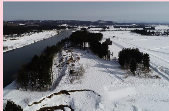
👉 ドローン空撮 大巻伐採箇所

今後も地域住民の皆様へ、ご不便をおかけしますが、工事へのご協力よろしくお願いたします。