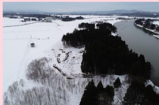
👉 樹木伐採工 完成

今後も地域住民の皆様へ、ご不便をおかけしますが、工事へのご協力よろしくお願いたします。