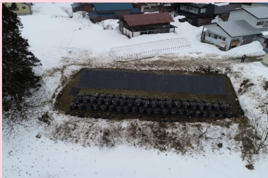
👉 法面保護工 完成

日頃より工事にご協力頂き、誠にありがとうございます。 今月の作業予定は下記のようになっておりますので、お知らせいたします。