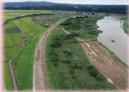
👉 現場内ドローン空撮写真

日頃より工事にご協力頂き、誠にありがとうございます。 今月の作業予定は下記のようになっておりますので、お知らせいたします。