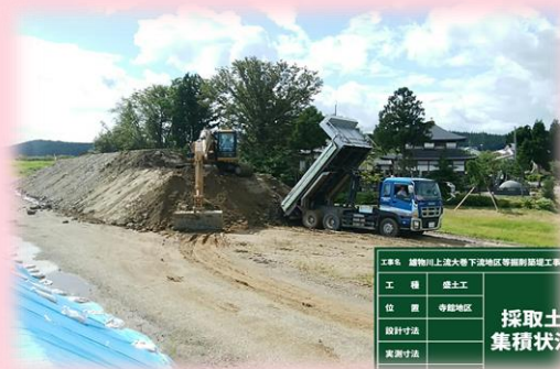
👉 寺館地区採取土集積状況