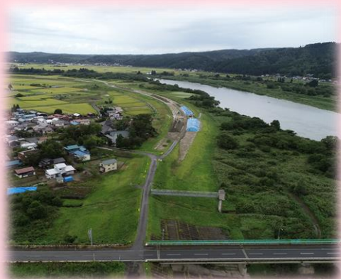
👉 現場内ドローン空撮写真