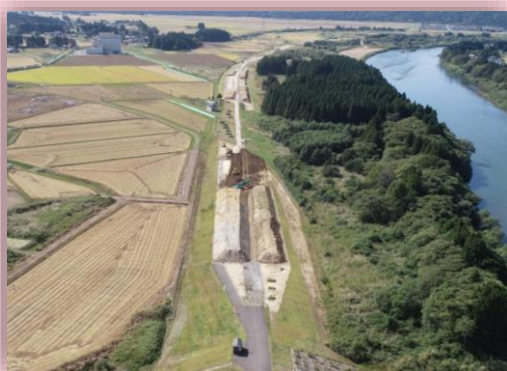
👉 現場内ドローン空撮写真