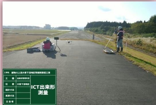
👉 ICTドローン測量状況