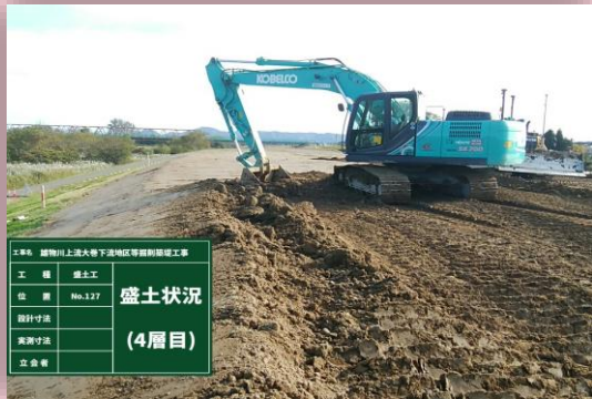
👉 寺館地区施工状況

現在、大巻地区及び寺館地区にて盛土工および法面整形工。十二ノ木樋門箇所にて盛土工および新設水路の基礎工を行っております。