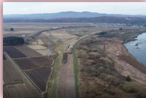
👉 大巻ドローン空撮状況