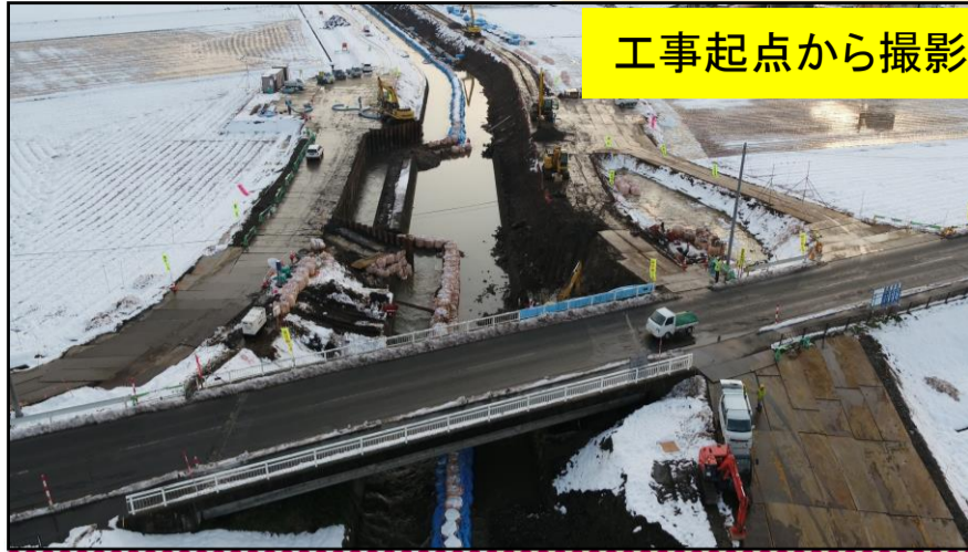
工事起点から撮影