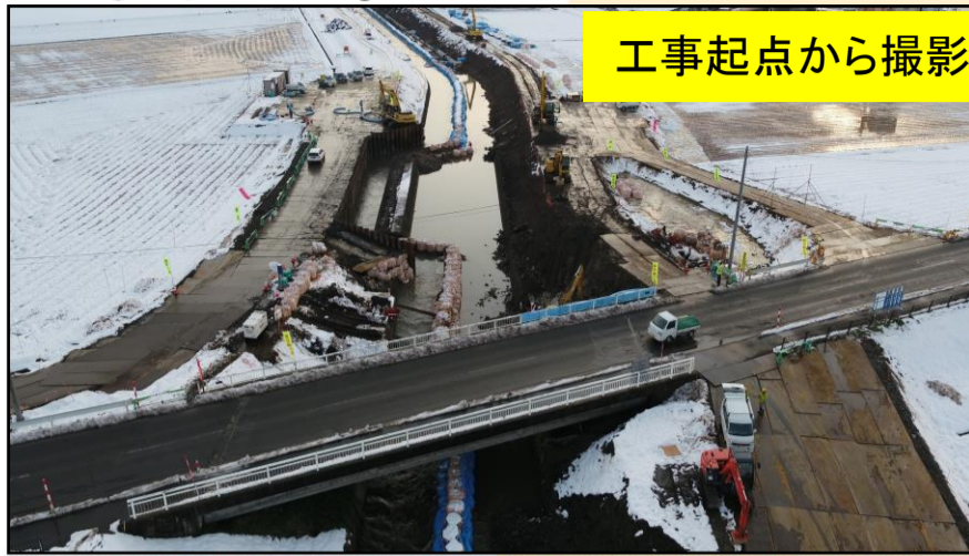
工事起点から撮影