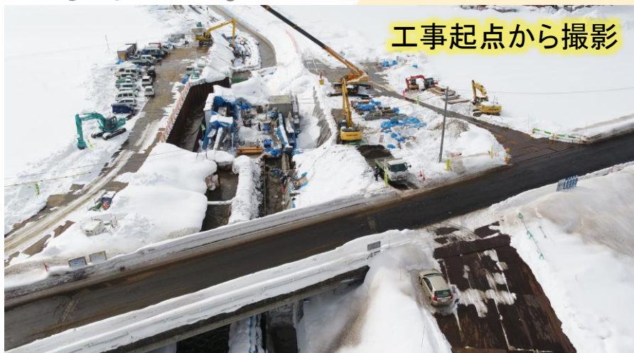
工事起点から撮影