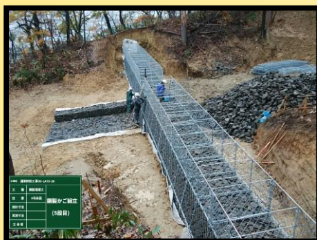
5号床固工 鋼製かご組立