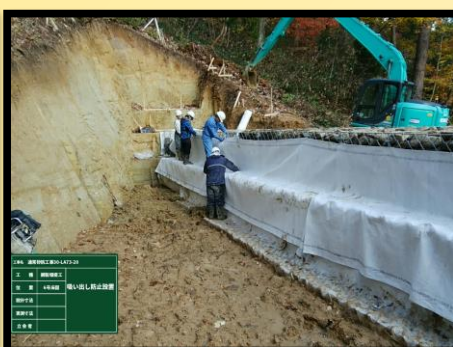
6号床固工 吸出し防止材設置状況