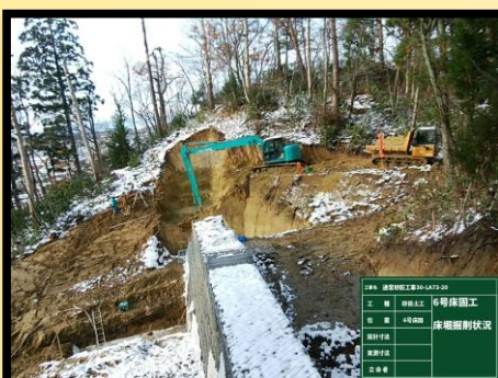
6号床固工 床掘削状況