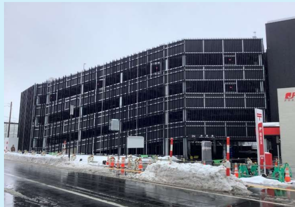
B-2棟(自走式駐車場) 外観