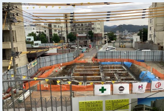
C-1棟 基礎コンクリート打設完了