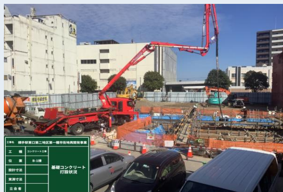
郵便局 基礎コンクリート打設