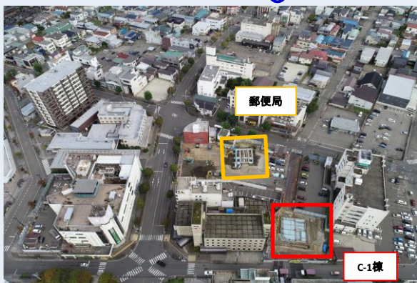
ドローンによる上空からの撮影