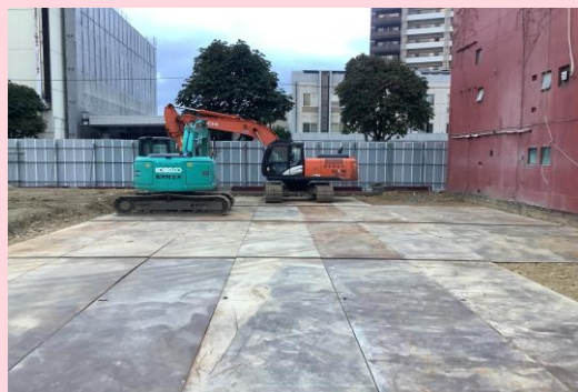
旧第一生命ビル 解体完了