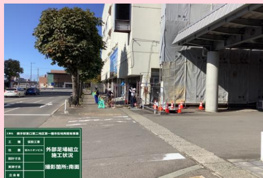
旧ユニオンビル 南面外部足場組立