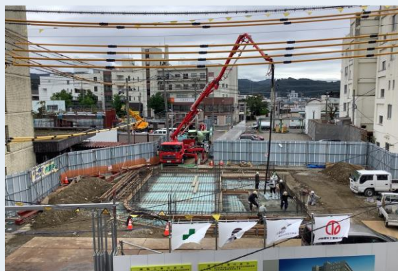
C-1棟 土間コンクリート打設