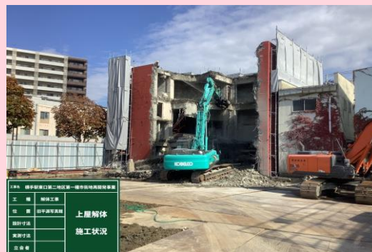
旧平源写真館 上屋解体状況