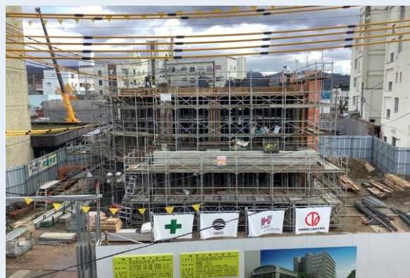
C-1棟 2階躯体配筋・型枠