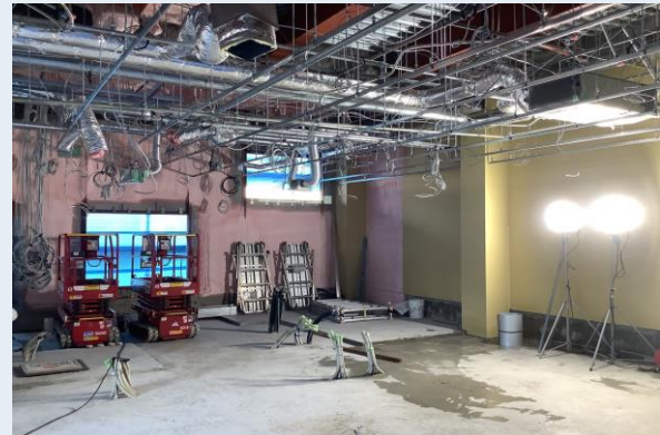
郵便局 天井下地・設備配管状況