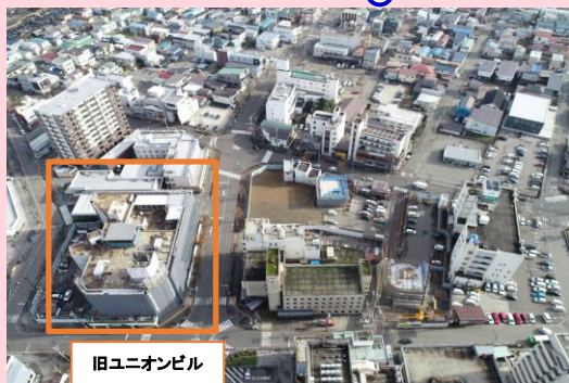
旧ユニオンビル ドローンによる上空からの撮影