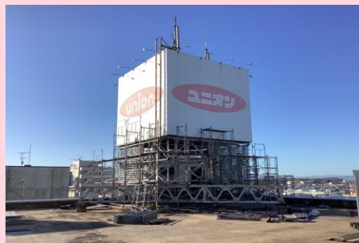
旧ユニオンビル 看板足場組立状況