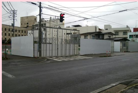
仮設工事 仮囲い設置状況