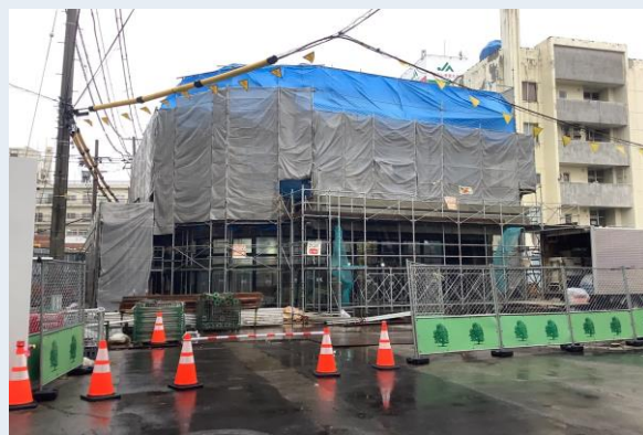
C-1棟 1階サッシ・ガラス取付け