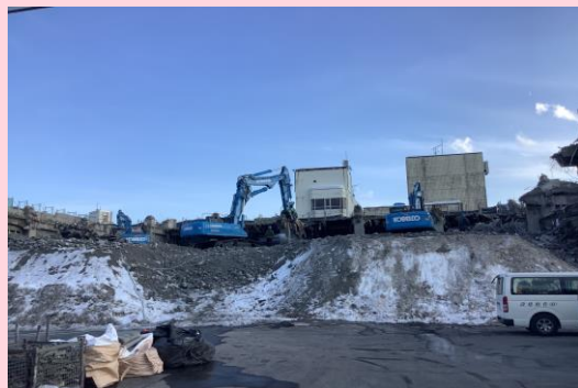
旧ユニオンビル 上屋解体