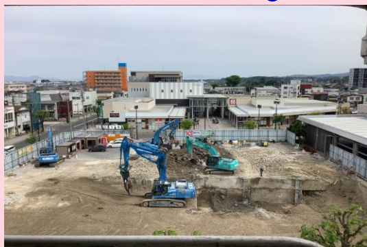
旧ユニオンビル 土間・基礎解体