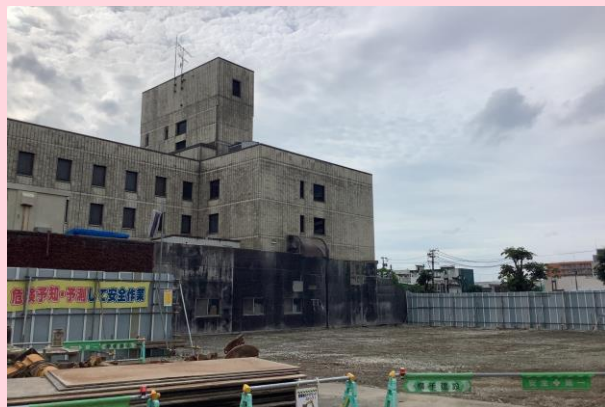
いずみビル 解体完了