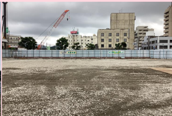
旧ユニオンビル 解体完了