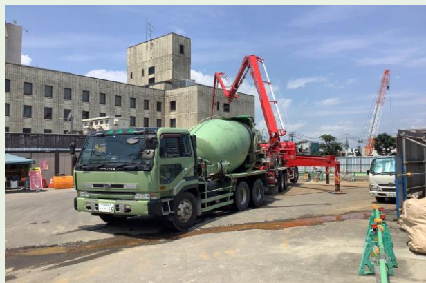
B-1棟 捨てコンクリート打設