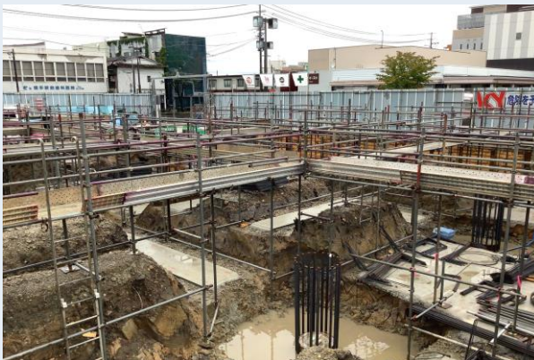
3・4工区 地足場組立状況