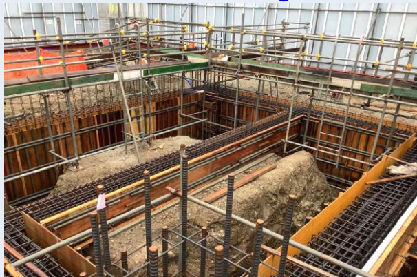
1工区 基礎型枠建込み状況