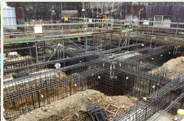
3工区 基礎配筋・圧接状況