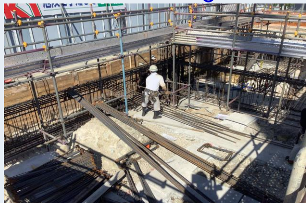
4工区 基礎配筋状況