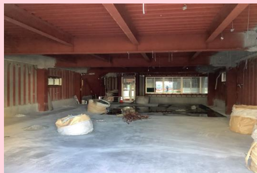
あたごビル 1階内部解体完了