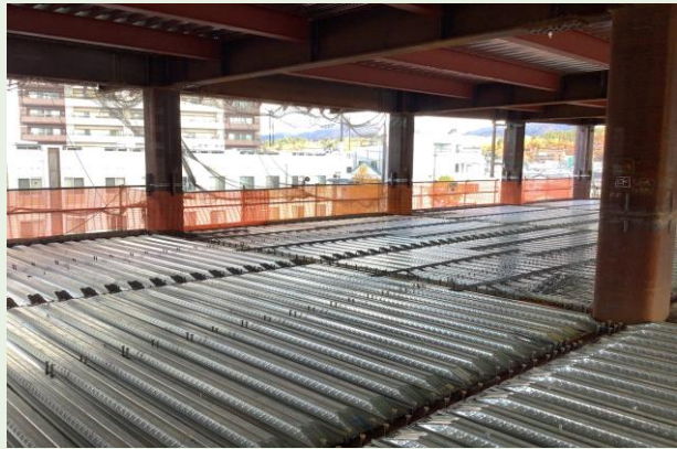
ABC工区 3階スラブ配筋段取り