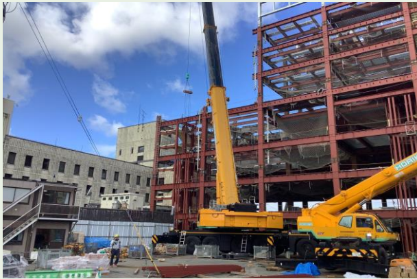
F工区 鉄骨建方状況