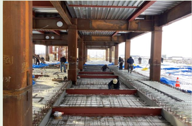
5階 スラブ配筋状況