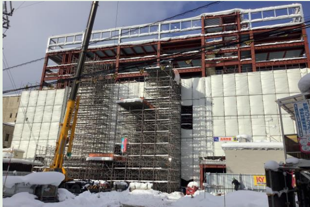
外部足場・構台組立状況