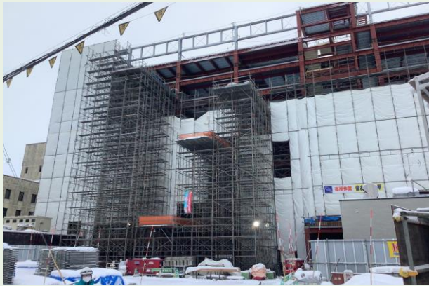
外部足場・構台組立状況