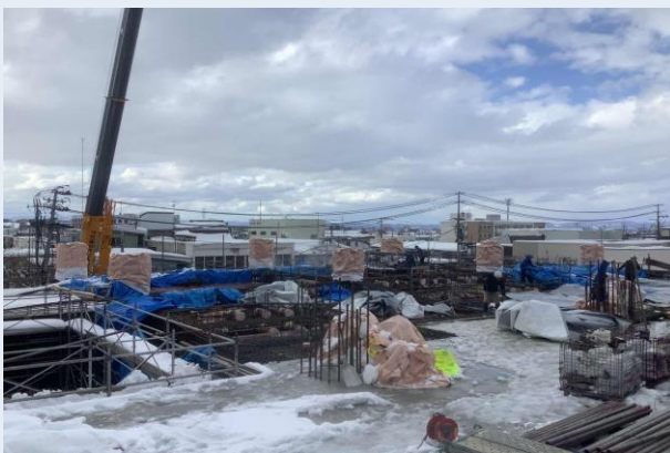
2階躯体配筋・型枠建込み状況