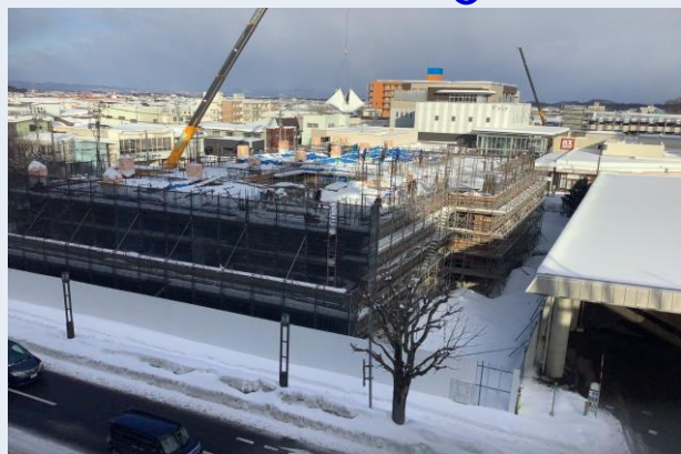
2階躯体配筋・型枠建込み状況