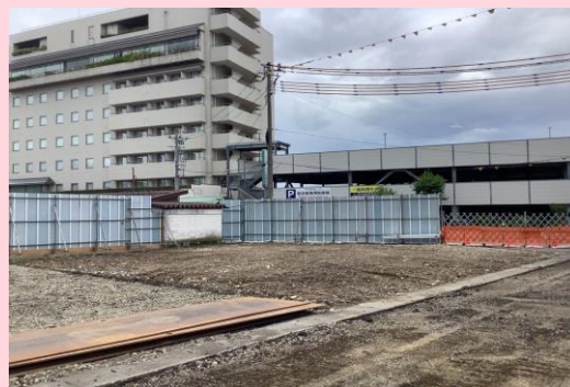
小川旅館 解体完了