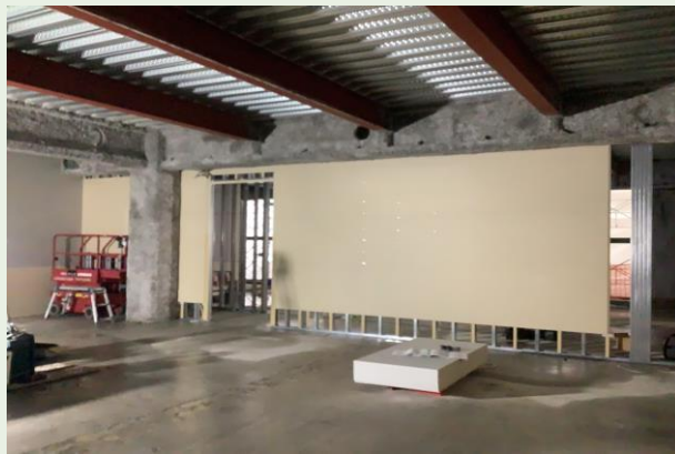
2階 壁下地・ボード張り状況