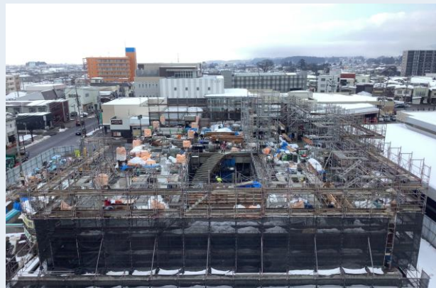
3階柱配筋・内部足場組立状況