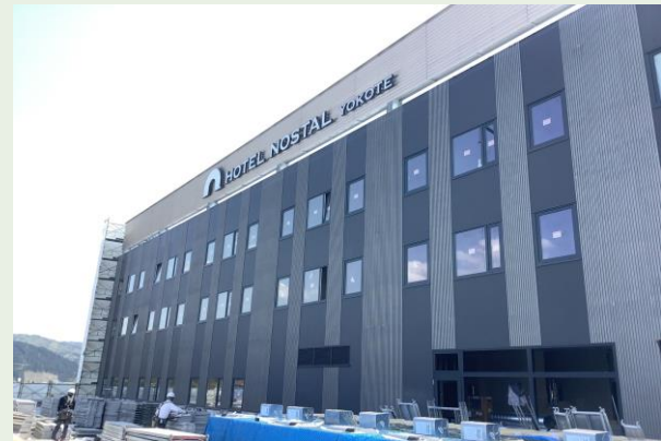
5階 屋上外部足場解体完了