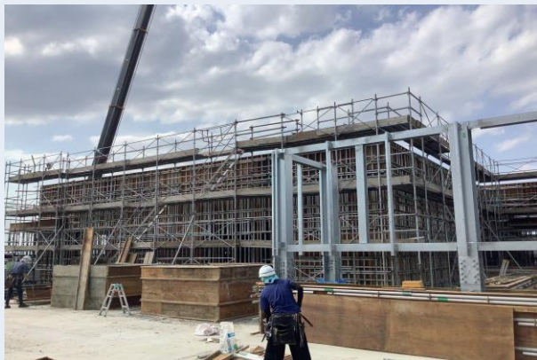
4階躯体型枠建込み状況