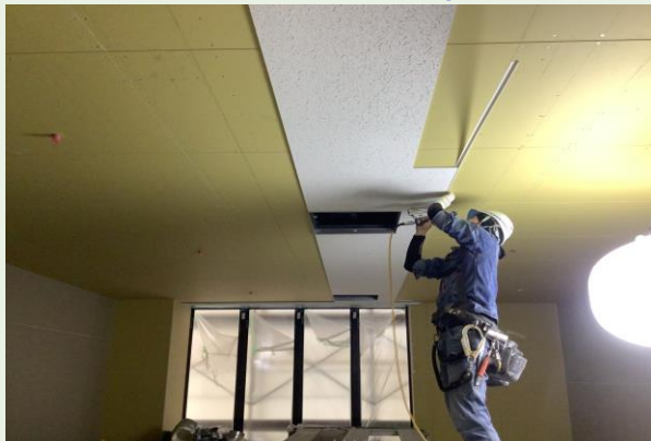
3階 天井仕上張り状況