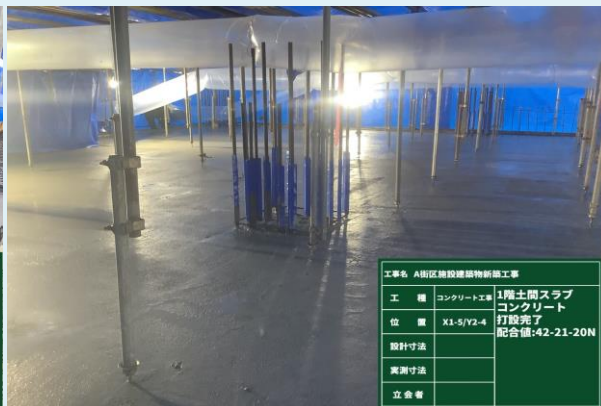
土間コンクリート打設状況