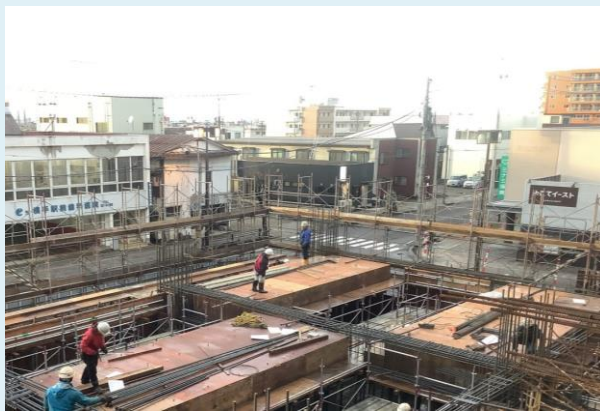
1階躯体配筋・型枠状況