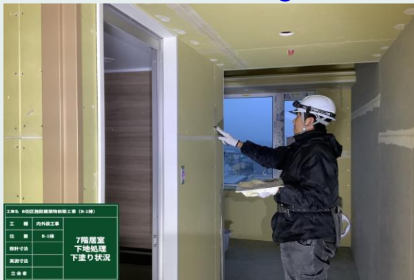
7階 クロス下地処理状況