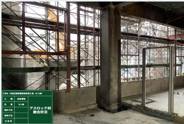
外壁アスロック撤去状況