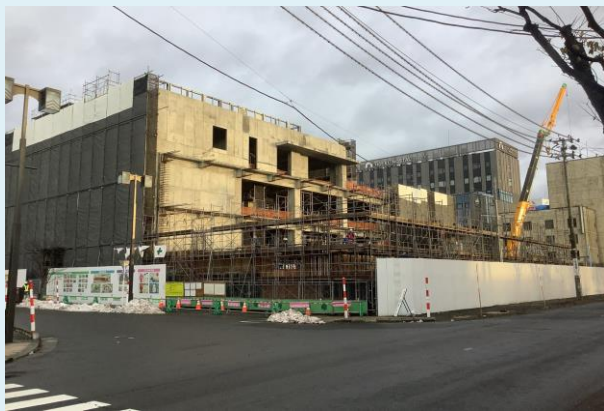
1階躯体配筋・型枠状況