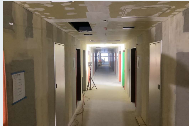
7階 クロス下地状況