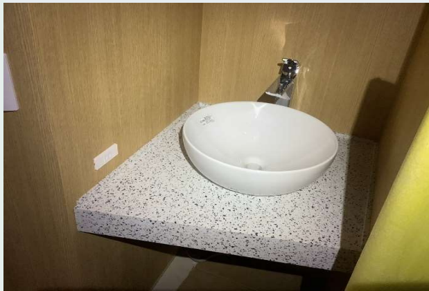
5階 洗面器取付完了