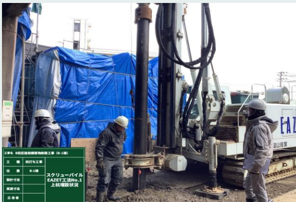
柱是正工事 鋼管杭打込み状況