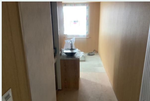
6階 洗面器取付完了