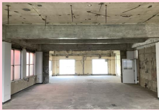
旧第一生命ビル アスベスト除去完了