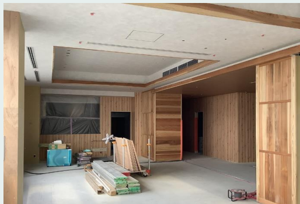
5階 天井クロス貼り施工状況