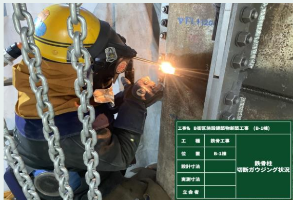
鉄骨柱 切断・溶接状況