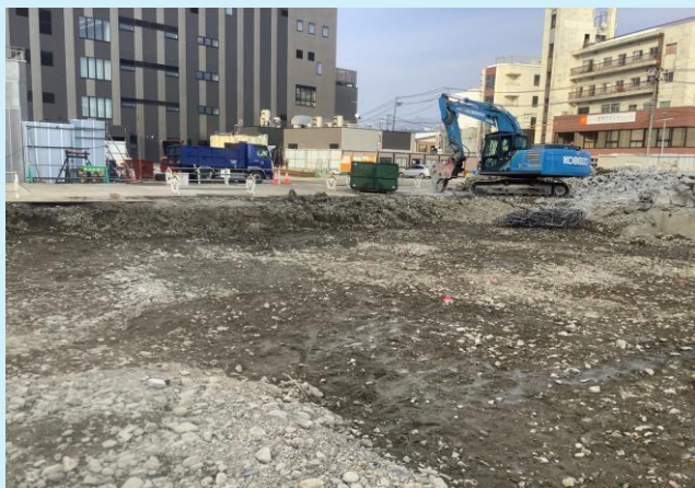
旧JA秋田ふるさと 基礎・土間解体状況