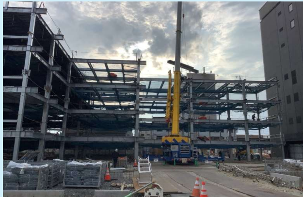
B-2棟 鉄骨建て方施工状況